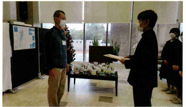
12月 和名ヶ谷中学生によるアイスチューリップの贈呈式