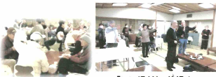
「いい湯だな」体操中！

取材した2月5日、スタッフは鬼のお面を頭に付けて節分の気分を出していました。この日の来訪者は19名で、普段に比べてやや少な目ですが、雪の予報が出た寒いお天気の中でよく来ていただいたとスタッフの方が話していました。来訪者は4~5人のかたまりになって座り、おしゃべりを楽しんでいましたが、小さなかたまりのところへはスタッフが座り、話し相手になったりしていました。お茶とお菓子の後は体操の時間で、皆で「いい湯だな」体操などをしていました。