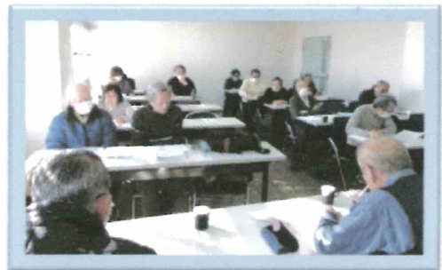
情報交換会の様子

質疑の時間には、感染対策や、活性化策、講師の探し方など色々な話題で情報交換があり、出席者からは参考になったとの声が出ていました。