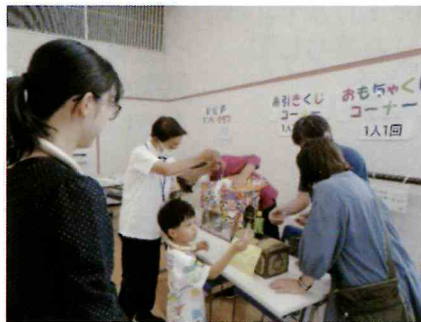
なにが出るかなおもちゃくじ