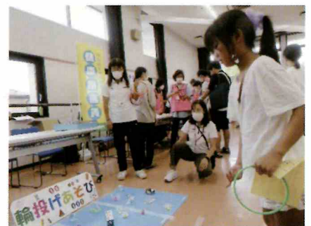
輪投げで景品ゲット