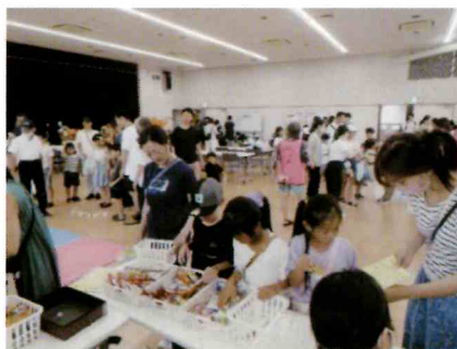
駄菓子屋さん完売