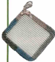
プレゼントのペットボトルオープナー