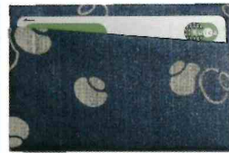
牛乳パックで作ったカード入れ

捨てられてしまいがちな牛乳パックやペットボトルキャップを使って生活に役に立つ「カードケース」と「マグネット」を制作して楽しくリサイクルし、ゴミを減らす提案をします。