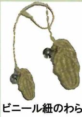
ビニール紐のわらじ

手づくり手芸をしてみませんか 着なくなった着物、又ビニール紐を使って新しい物を生み出します。ビニール紐で「わらじ」の根つけを作り、古着を利用して「桃人形」を作ります。会場には色々な「桃人形」と「つるし雛」の展示も行っております。*当日「桃人形」作りに参加される方は材料費、百円がかかります。