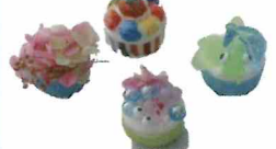
ペットボトルのキャップを使ってマグネット