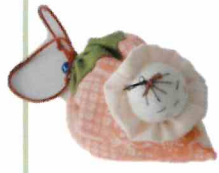
古着で作った桃人形