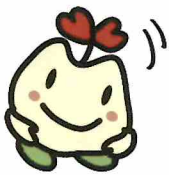
おじぎまっころん