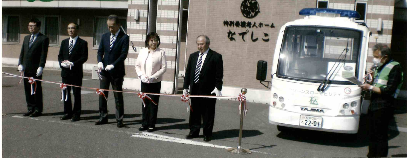
右から、司会 菊谷(矢切グリーンスローモビリティ運営本部事務局長)、町山連合会長、増田市議会議員、末松市議会議員、深山市議会議員、特別養護老人ホームなでしこ 鶴岡施設長