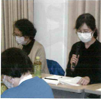
▲評議員会各部報告

【出席者40名・委任状15名】 令和5年度の事業活動報告・収支決算報告及び令和6年度の事業活動計画・予算案について審議されすべての案件が承認されました。